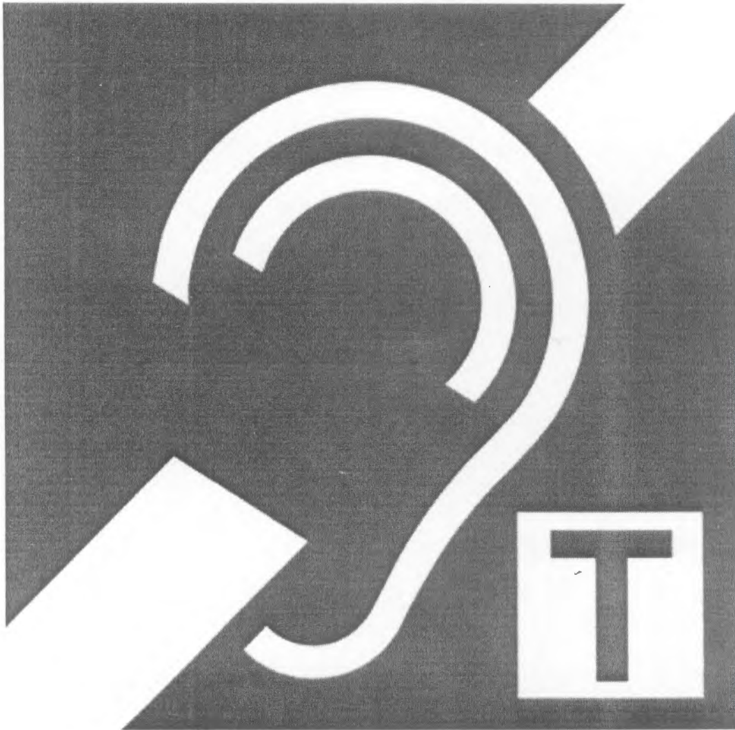
Señalización de Accesibilidad Internacional de Aro Magnético